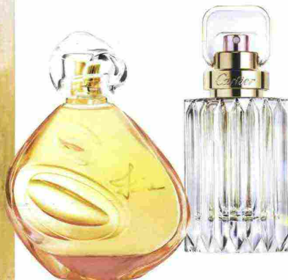
Luminosi. Da sinistra, "Currents" (2017) di Judith Murray, in mostra alla Sundaram Tagore Gallery, a New York, fino al 6 ottobre; Izia, Sisley Paris (180 €); Carat, Cartier (91,50 €).