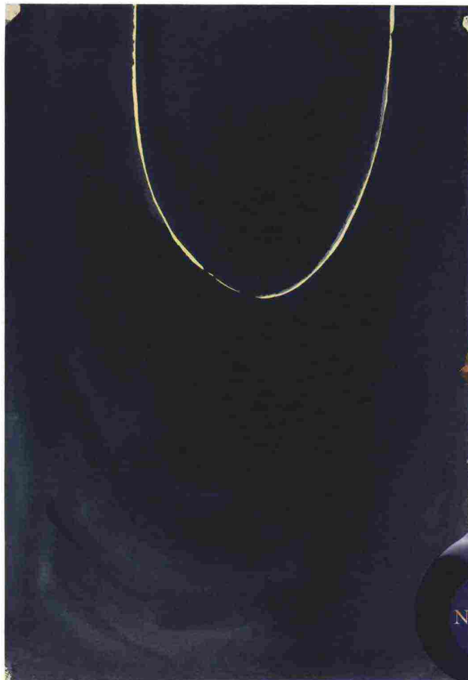
Di sostanza. A sinistra, "Untitled" (1924) di Hilma af Klint. Sotto, da sinistra in senso orario, Notturmo, I profumi di D'Annunzio (160 €); Addictive Arts, Clive Christian (740 €); Moonlight Shadow, Prada (250 €); La Nuit Trésor à la folie, Lancôme (97 €).