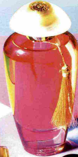
THE MERCHANT OF VENICE Suave Petals, profumo femminile seducente, con flacone in vetro di Murano. 100 ml, 132 euro. themerchantofvenice.com