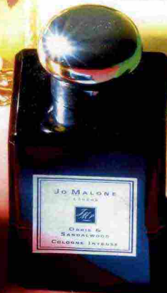
JO MALONE Orris e Sandalwood Cologne Intense, accattivante e coinvolgente. 50 ml, 90 euro. jomalone.eu