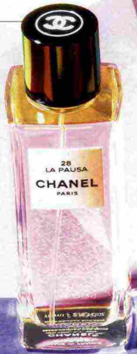
CHANEL Un orris terroso e cipriato, radioso e segreto nella piramide di Les Exclusifs. 28 La Pausa. 75 ml, 175 euro. chanel.com