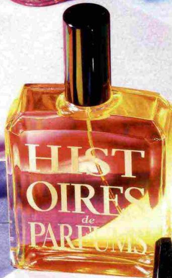
HISTOIRES DE PARFUMS L'eau de parfum Mouline Rouge ha note di rosa, orris, ambra e vaniglia. 120 ml, 155 euro. cale.it