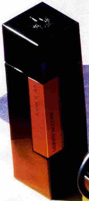
LAURENT MAZZONE Etereo e caldo, il Radikal Iris Extrait de Parfum. 100 ml, 220 euro. aquacosmetics.com